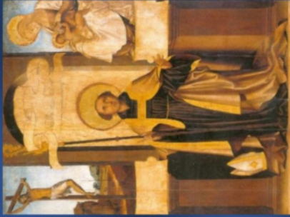
Primo Caruso, Paolo di Sant'Agostino ante 1537 Cagliari Pinacoteca Nazionale